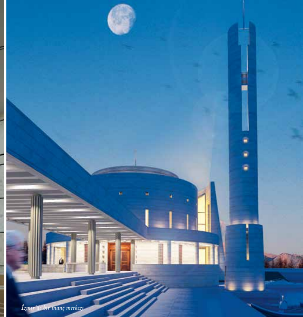
İzmir'de bir inanç merkezi

9- Son dönem gerçekleştirdiğiniz projeler ve gerçekleştirmek istediğiniz projeler hakkında bilgi verebilir misiniz?