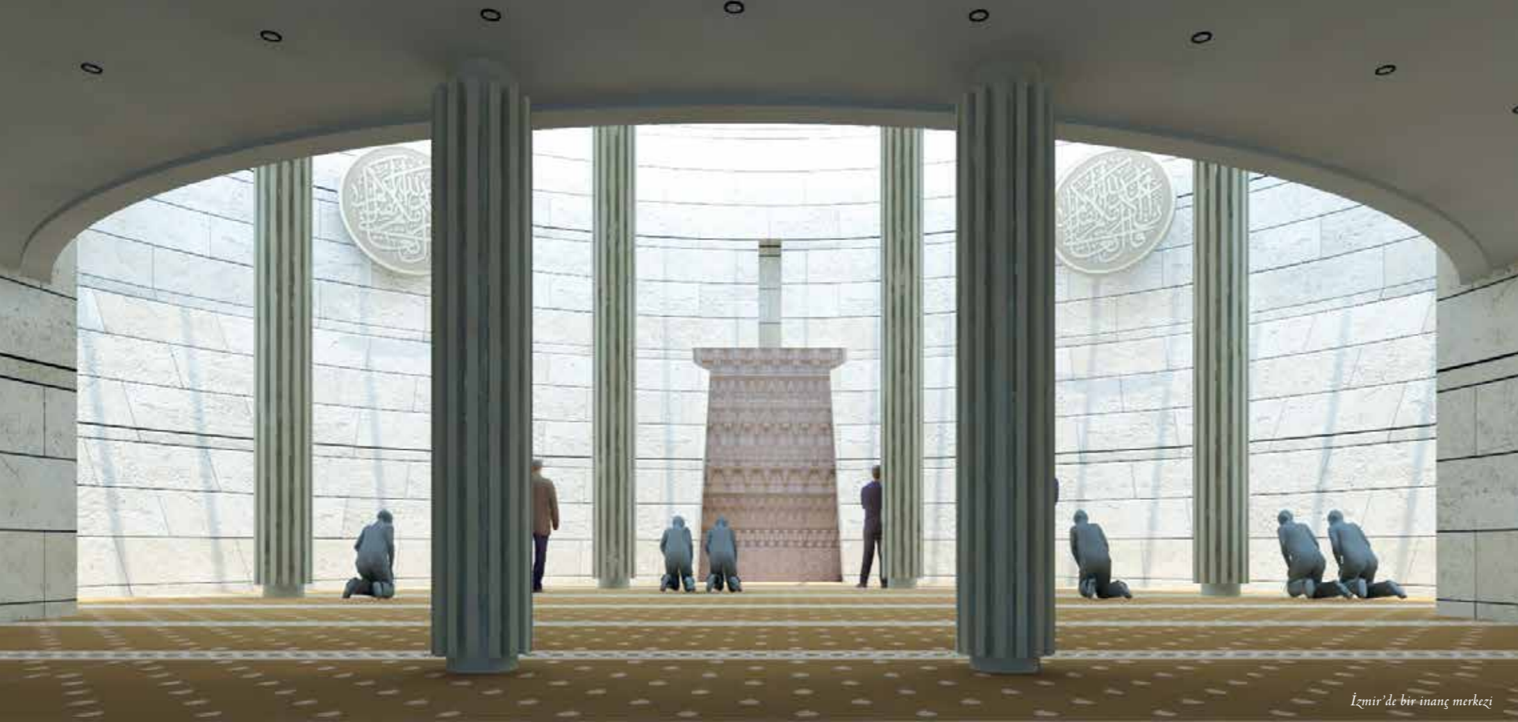
İzmir'de bir inanç merkezi